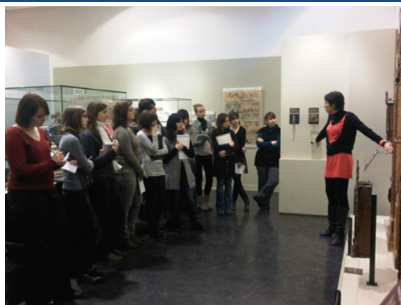
Sensibilisation 2 ème année de BTS Tourisme Lycée Camille Saint Saëns de Rouen

Cette année, les élèves ont pu découvrir le Musée de l'Horlogerie à Saint Nicolas d'Alérimont labellisé en janvier 2011 pour les quatre familles de handicap. La journée s'est ensuite poursuivie au sein de l'Office de Tourisme de Dieppe Maritime qui souhaite obtenir le label dans ses nouveaux locaux qui seront inaugurés en avril .